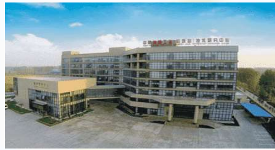
氮肥技術研究中心