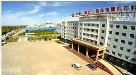
水肥一體化工程技術研究中心